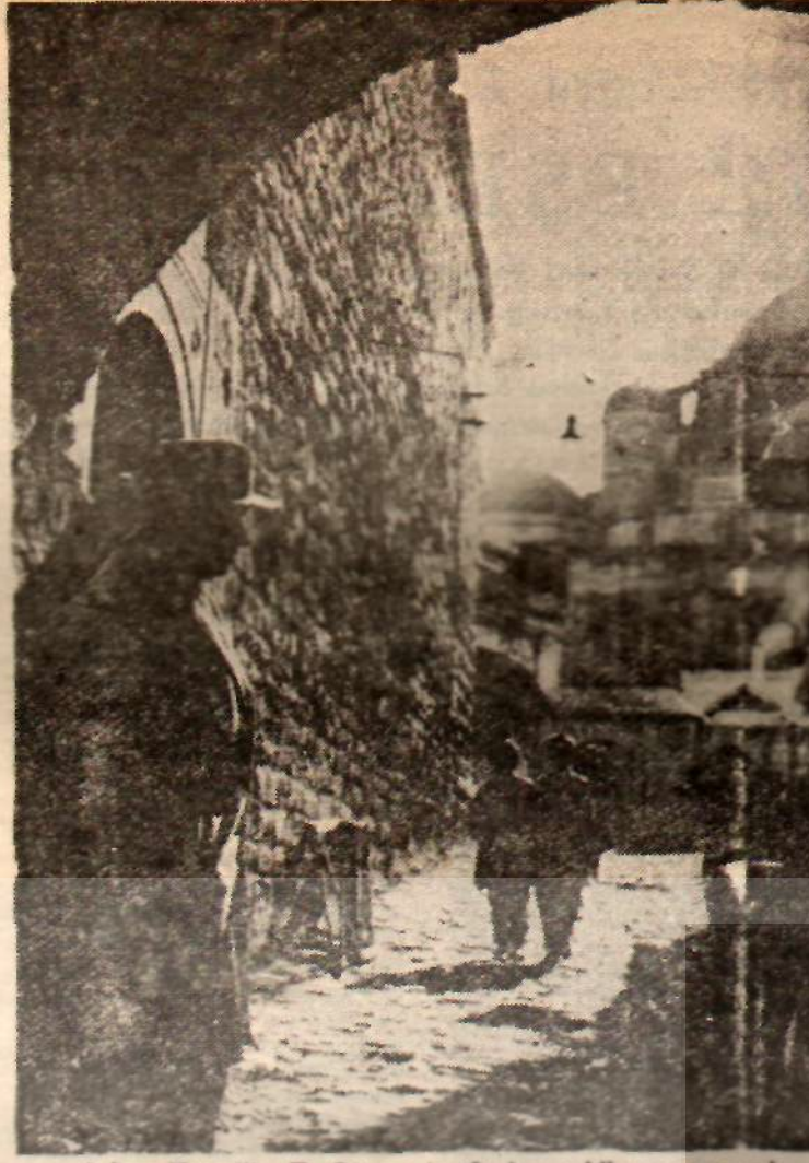
Orhan Kemal'in son resmi

...Sabahleyin cebimde bütün bir on teklük vardı. Bakkalda bozdurup kariyla paylaştık, cad deyî tuttum. Başımada tavşan derisinden fôr şapka! (Bu mahudu hatırlarsın geçen seneden