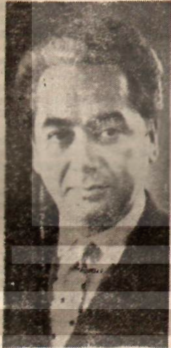
Prof. Muammer Aksoy «Bizden söylemesi...»

Aksoy, daha sonra Anayasaya giren yenilikleri ve kurumları bir bir saydı: «Demokrasi, sadece bir