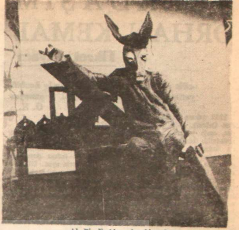
«Ah Biz Eşekler» den bir sahne

CEVAP — Bu teklifi Sayın Aziz Nesin attı: ortaya, ben de katıldım. Neden gösteriş, neden oyun? Kendi adına konuşayım. Hikâyelerden yaptığımız uygulamalar, bugün de ülkelerimiz büyük kentlerinde uygulanmakta olan ve adına «Gazete Tiyatrosu», ya da «Kabare Tiyatrosu» denilen bir tiyatro türü. Bu tiyatro türü lütfi etmem bir rastlantı değil. Bir tiyatroya türüdür bu. Tiyatroyun, dram