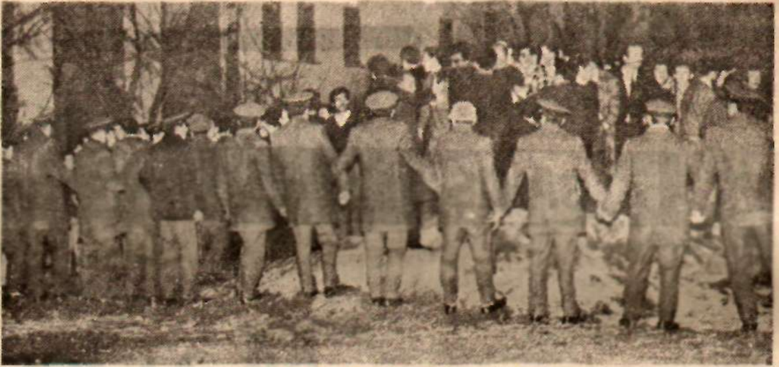
Siyasal Bilgiler Fakültesinde polis kordonu Acı hatıralar

Bu arada Fikir Kulübü Başkanı, Aybar'ı Meclis'ten alıp geliyor ve kapıda Siyasal Bilgiler ve Hukuk öğrencilerinden kurulu bir manga ile karşılaşıyordu. Aybar, bu sıkı kordon arasında kalabalık koridoru geçerken sâkin ve mütebessim yürüyordu. Aybar, salona girişinde alkış ve yuhalarla selâmlandı. Fikir Kulübü yöneticilerinin konuşmasından sonra, Mehmet Ali Aybar gürlütüler arasında kürsüye çıktı. Fakat daha ağızını açar açmaz saldırgan grubun çılgınlığıyla karşılaştı. Aybar, saldırgan gruba hitaben, aralarında art niyetli kişilerin bulunacağını sanmadığını, gençlerin yurt sorunlarını olgunluk içinde dinleyeceğini söylediysede, «istememezükçü»ler Aybar'ın bu görüşünü derhal tekip ettiler. Bundan sonra Fikir Kulübü Federasyonu Başkanı Hüseyin Ergün bir konuşma yaparak ortalığı yatıştırmak istedi. Ancak saldırganlar kararlı gelmişlerdi. Aybar tekerâz söz alarak Osmanlılardan bu güne kadar rejim sorunlarını anlatmaya başladı. Osmanlı devletindeki toprak mülkiyetinin niteliğini anlatarak sanayi devriminin etkilerini açıklıyordu. Bu bilimsel açıklamaları pek anlamayan saldırganlar bir süre sustular. Ancak içlerinden bazı meraklılar, birbirlerine sözü geçen sanayi devriminin «Rus devrimi» olduğunu söyleyerek Aybar'ın komünist propagandası yapıp yapmadığını soruyorlardı. Bu sessizlik, saldırgan grubun «Moskova'ya... Moskova'ya»